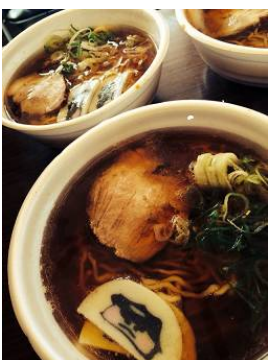
「ラーメンー平ちゃん」