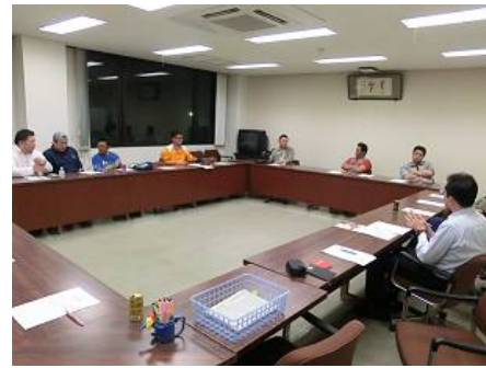
部員ディスカッションの風景

時代というか、組合や様々な会等に参加されない、逆に参加しなくても、何ら問題なく生活・仕事が出来てしまう現状で会費を支払い、会議や例会などで時間を拘束されてしまうのはちょっといやだなと思ってしまふのは当たり前前事！（自分自身も当初は会議・例会・付合い、面倒くさ！！と思っていました）しかし、真剣に青年部活動に取り