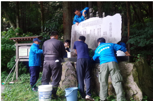
▲ 記念碑をピカピカに

夕日の滝までの通路が新しく綺麗に整備され、登山客や観光客がより多く通る場所になった