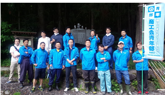
▲ 最後にパチリ。全員写れました