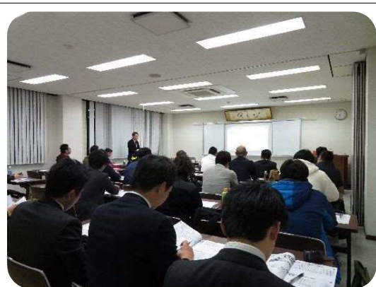
セミナー開催の様子