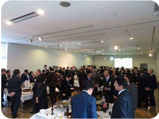
南足柄市商工会青年部は

青年部OBはじめ地域の皆様に支えられ50周年という節目を迎える事ができ、当時部員であったOBが築き上げた実績と継続した活動の上に今日があるという事を青年部一同胸に刻み、決意を新たに、今後もかけがえのない人たちと地域のために、青年部は活動し続けていくでしょう。