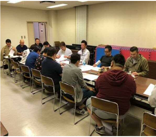
部員ディスカッションの様子

ションでは答えがでることはありませんでしたが、総務としても概ねの進む方向も決まり、部員がより良い形を迎えられ様な話し合いだったと思います。