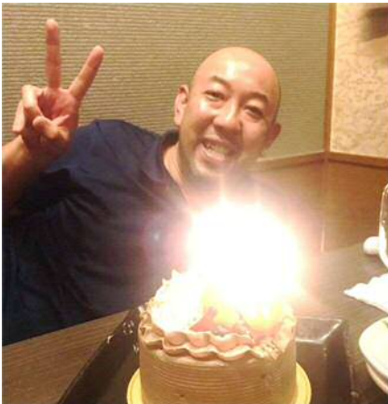
45歳ががんばります!!

陰陽思想では奇数が「陽」。偶数が「陰」となっています。陰陽思想は奇数を尊び偶数を嫌うという傾向があるので「1」は最初の奇数として神聖なものであり特別な数。「2」や「4」など割り切れる数字は「対立」を予感させます。「3」は最も区