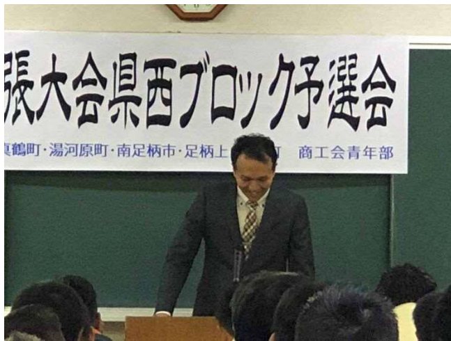
「想いを込めて主張しました」

残念ながら、予選落ちしましたが「一番よかったよ」とか「感動ものでした」など、南足柄の仲間には、好印象をもつていただけたようで、発表してよかったと思います。応援にきていただいた方、ほんとうにありがとうございます。