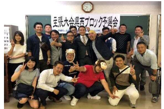
動物たちも応援に駆け付けました

発表を残念ながら、聞きにこられなかった方で、南足柄で開業した理由や今後の目標を聞きたい方もおられるかもしれませんので、この場を借りて簡略化して話しておきます。